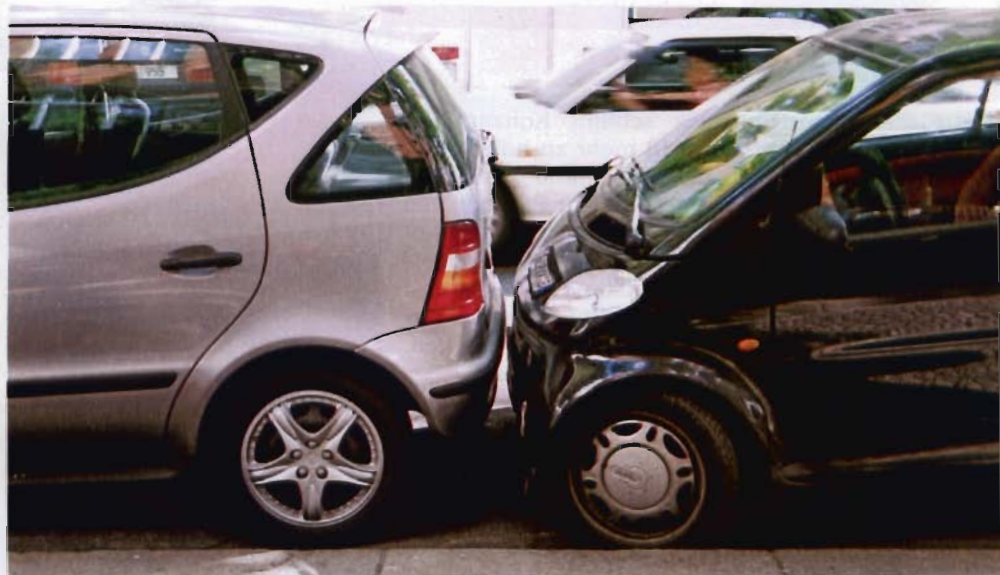
NUR WENIGE ZENTIMETER Die Gauner profitieren von der hohen Parkdichte