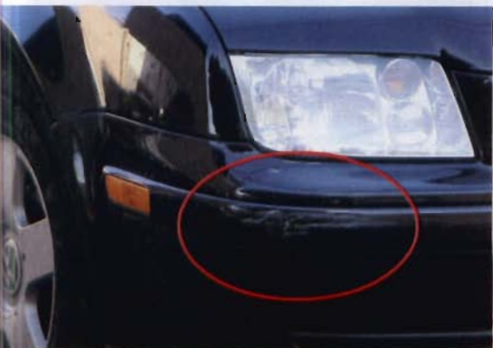
ZERSCHRAMMT Versicherungsbetrüger stellen sich mit bereits zerdellten Wagen in Parklücken und schieben die Schäden dann unschuldigen Autofahrern unter